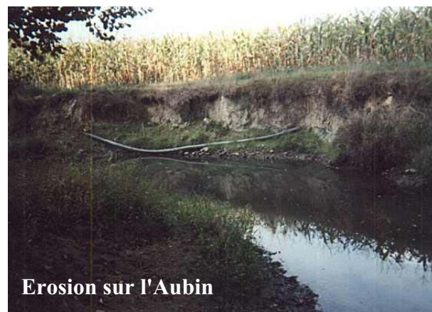
Erosion sur l'Aubin

Un marché a été lancé par la Communauté de Communes d'ARTHEZ-DE-BEARN (en partenariat et avec l'aide des acteurs institutionnels de l'environnement) pour une étude de restauration et d'entretien des rivières du Luy, du Lech et de l'Aubin.