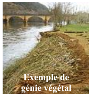
Exemple de génie végétal

D'une durée de six mois, cette étude a pour objectif de mener une réflexion globale à l'échelle des bassins versants afin de dresser un bilan des connaissances, de réaliser des investigations de terrain, d'élaborer un diagnostic, de déterminer les objectifs de gestion et un programme pluriannuel de restauration et d'entretien sur ces trois cours d'eau : Le Luy-de-Béarn pour un linéaire d'environ 12 km, l'Aubin pour 22 km, et enfin du Lech, affluent de l'Aubin, pour 6,5 km. La priorité sera donnée à la méthode douce (revégétalisation, palplanches, fascinage...) afin de restaurer au mieux le milieu naturel du réseau hydrographique, tout en équilibrant quantité et qualité de l'eau.